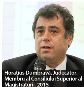
Horațiu Dumbravă, Judecător, Membru al Consiliului Superior al Magistraturii, 2015